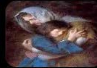
3. Bienaventurados los que lloran: porque ellos serán consolados.