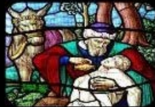
5. Bienaventurados los misericordiosos: porque ellos obtendrán misericordia.