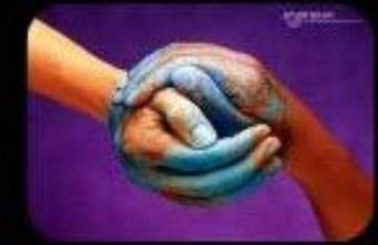
4. Bienaventurados los que tienen hambre y sed de justicia: porque ellos serán saciados.