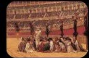
8. Bienaventurados los que sufren persecución por la justicia, pues de ellos es el reino de los cielos.