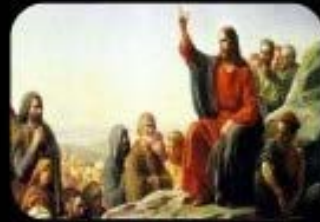
1. Bienaventurados los pobres de espíritu: porque de ellos es el reino de los cielos.