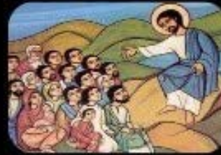
2. Bienaventurados los mansos: porque ellos poseerán la tierra.