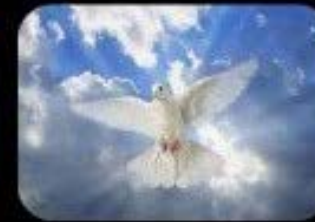
7. Bienaventurados los pacíficos: porque ellos serán llamados hijos de Dios.