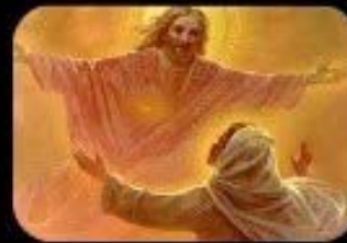
6. Bienaventurados los limpios de corazón: porque ellos verán a Dios.